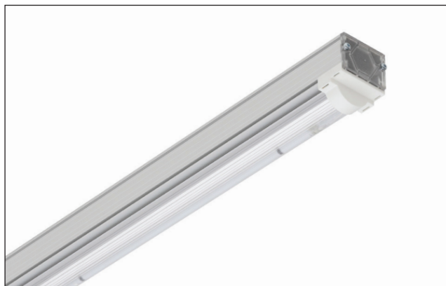
UNN140 SBH & UNN240 SBH